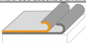
SF – Strato a finire EN 13707

TECHNINICOL ITALIA srl reserves the right to modify the technical data in this specification sheet, which is based on current production without prior warning.