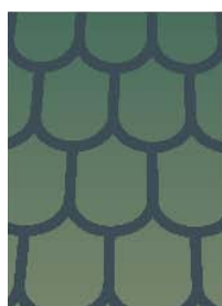
DISEGNO 2 – TEGOLA